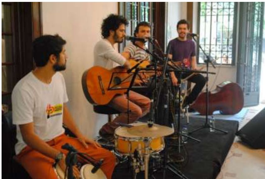
Recital de Música de Câmara da USP