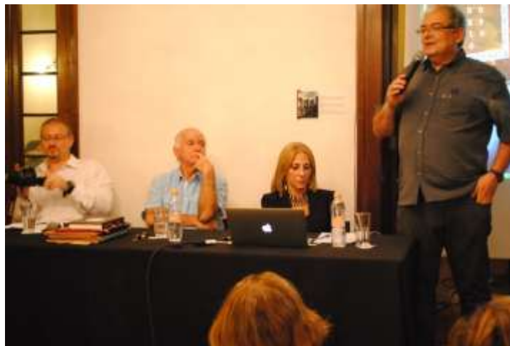
Encerramento do curso Jardim Alheio , com a presença do escritor Ignácio de Loyola Brandão, autor de Zero

Rosas realizou diversos eventos com o intuito de relacionar a produção literária do período e os acontecimentos sociais e políticos da época. A programação especial “50 anos de ditadura” teve início com a oficina Jardim Alheio, que convidou o público a debater o icônico romance Zero , de Ignácio de Loyola Brandão, no último dia do ciclo, não por coincidência, o primeiro de abril. Além desta, o Curso “Literatura Censurada”, ministrado por Reynaldo Damazio, o Sarau “Poesia X Ditadura” e o recital em homenagem aos 50 anos do Movimento Catequese Poética, encabeçado por Lindolf Bell, são os melhores exemplos desta programação, que recebeu um ótimo público.