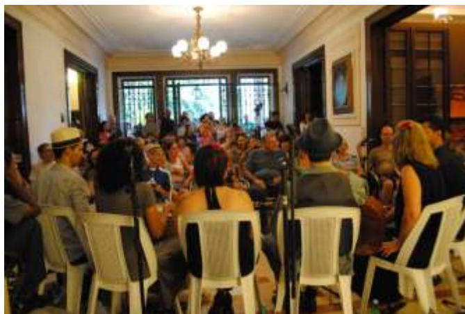
Sampoemas, 2014 – Jabá Sintético: As músicas de Adoniran que a rádio não toca