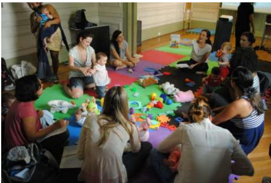
Literatura de berço homenagem Tatiana Belinky, no mês das crianças

Foi acolhido com sucesso o ciclo especial de oficinas “Literatura de Berço”, que consiste em conversas sobre a obra dos principais escritores brasileiros, enquanto pais e mães de filhos de primeira idade podem trazer seus pequenos para a sala, sem maiores receios ou cuidados.