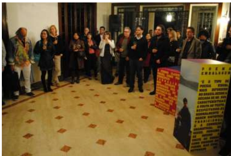
Abertura da exposição Goma de Mascaram Sabor mental, que homenageou a produção de Philadelpho Menezes