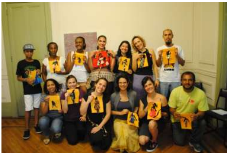
Produção de Abayomis , bonecas de origem africana, na Roda de Compartilhamento de Experiências

resgatar, por meio da memória coletiva, as influências que recebemos dos povos vindos de África. O encerramento, realizado pelo Cupuaçu, teve a apresentação de Tambor de Crioula, uma manifestação tradicional, presente principalmente no Estado do Maranhão, e que representa uma resistência cultural dos negros africanos e seus descendentes em solo brasileiro, além de associar-se aos festejos de São Benedito, santo protetor dos pretos.