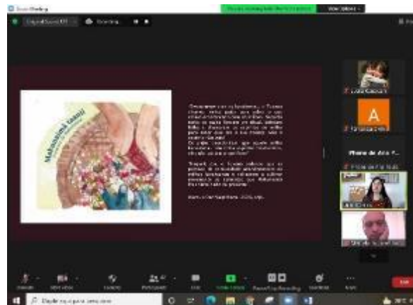
Palestra "Literatura indígena", com Julie Dorrico. Data: 17/03/2022