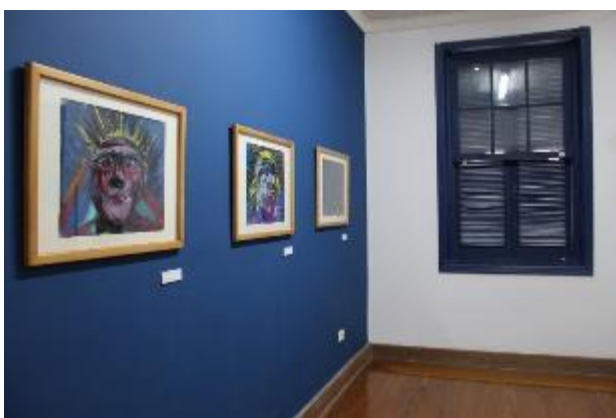
Exposição "Rostos indígenas: Retratos por Graça Arnús", inaugurada em maio de 2022