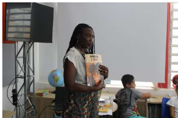
Reexistencias Negras, Fábrika Osasco, novembro