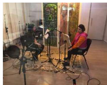
ESTÚDIOS_BIBLIOTECA - CAPTAÇÃO DE ÁUDIO PARA VÍDEO, nov 2023