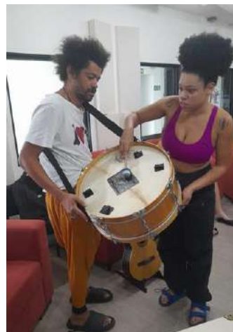
DDM_VIRADA INCLUSIVA APAE EM CENA, dez 2023