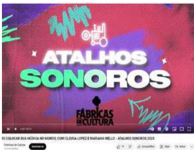
ESTÚDIOS_COMO COLOCAR SUA MÚSICA NO MUNDO, nov 2023