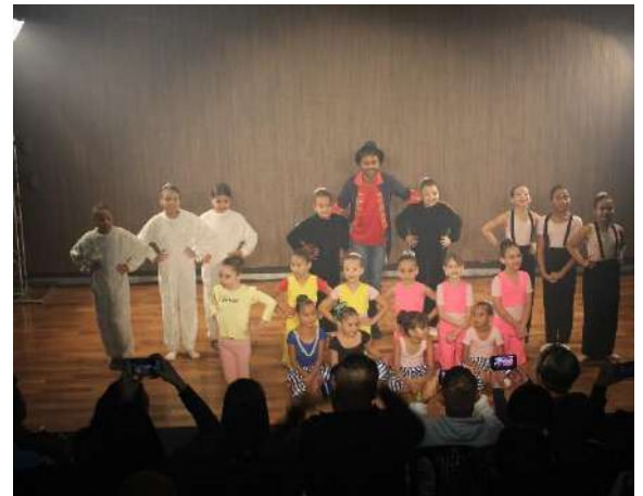
Mostra de Processos, Fábrica de Cultura de Osasco, novembro