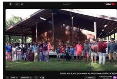
ESTÚDIOS_MÚSICA ESPÍRITO POVO GUARANI MBYA DE IGUAPE E SUA MÚSICA, out 2023