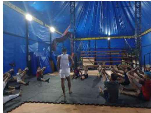
FOLIA, nov 2023