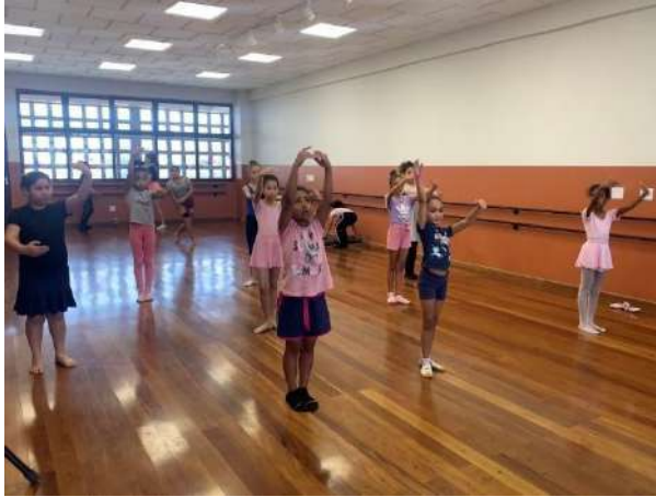
Trilha de Balé, Fábrica de Cultura Jaçanã, setembro