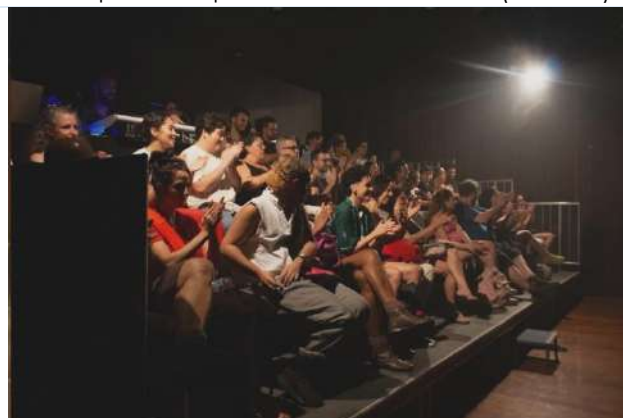
Ciclo II | Espetáculo Beira – Plateia (16.12.23)