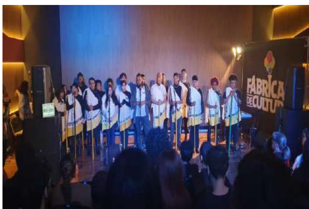
Encontro Musical Coral da Fábrica Capão Redondo, setembro