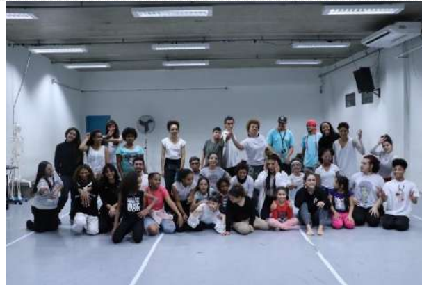
Ciclo II | Encontro Fábrica Osasco (20.10.23)