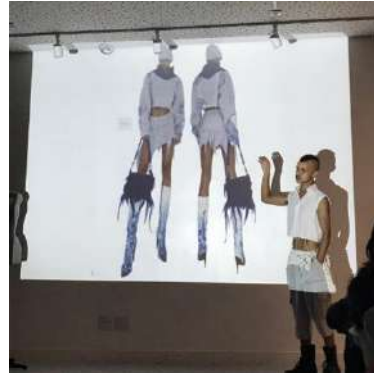
NÚCLEO DE MODA_MODALIDADE CRIATIVA COM BRABO.BR, out 2023