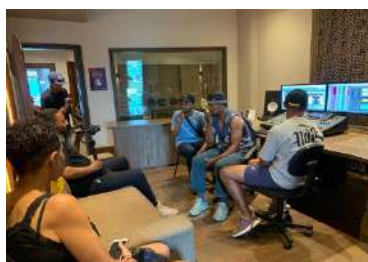
ESTÚDIOS_ATENDIMENTOS, ago 2023