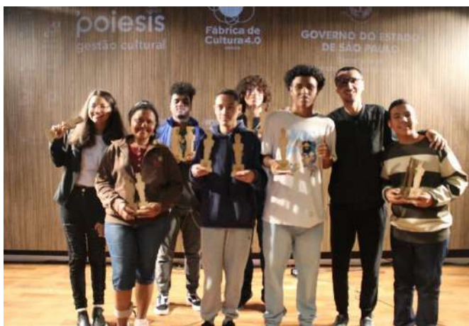
Ateliê de Cinema e Vídeo, Fábrica de Cultura Osasco, novembro