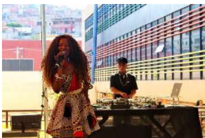
BRL_Festival AfroBrasa, nov 2023