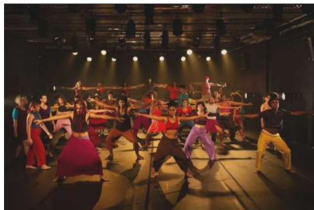
Ciclo I | Espetáculo DeComposição (30.11.23)