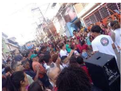
CPR e JSL_Festival 100_ Favela, set 2023