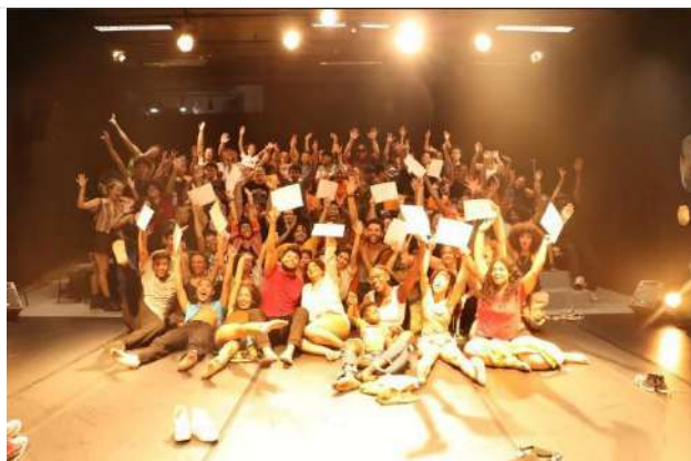
Oficina | Encerramento (16.11.23)