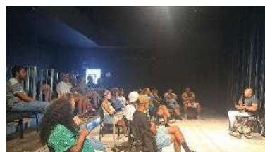
JÇN_VIRADA INCLUSIVA "A INCLUSÃO DA PESSOA COM DEFICIÊNCIA NO MERCADO DE TRABALHO", dez 2023