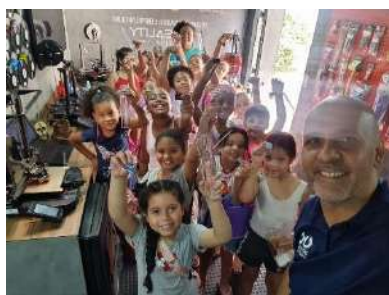
CPR_FESTIVAL TECNICAMENTE FALANDO CAMINHÃO DE INOVAÇÕES COM OFICINAS MAKE, nov 2023