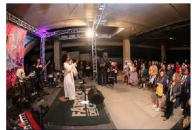
JSL_Mostra Cooperifa, nov 2023