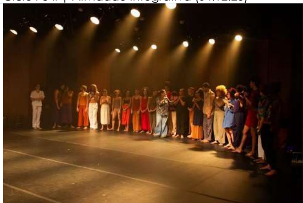
Ciclo II | Espetáculo Beira (15.12.23)