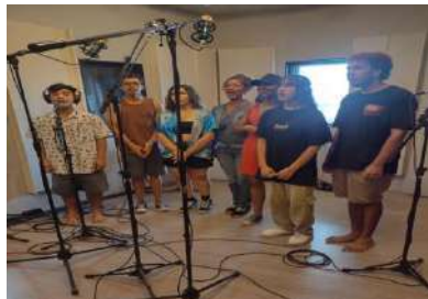
ESTÚDIOS_PROJETO ESPETÁCULO – GRAVAÇÃO, nov 2023