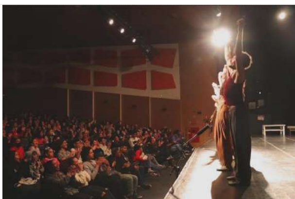
Ciclo II | Espetáculo na Fábrica V. Curuçá (28.09.23)