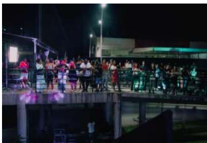
NÚCLEO DE MODA_DESFILE ENTRE TRAMAS E DRAMAS, dez 2023