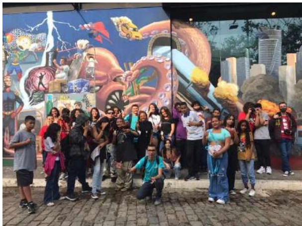
Saída pedagógica, Beco do Batman, Fábrica de Cultura Osasco, setembro