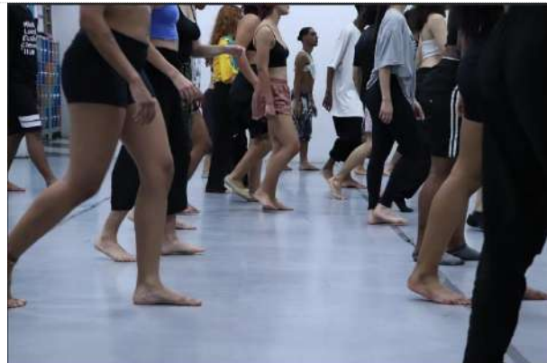
Oficina | Aula de Prática Corporal (26.09.2023)