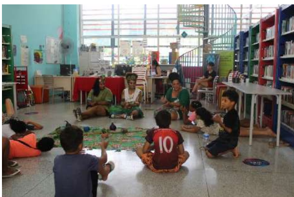
Auto Cuidado Com As Plantas, Fábrika Brasilândia, novembro