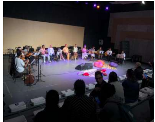
Mostra de Processos, Fábrica de Cultura Jaçanã, novembro