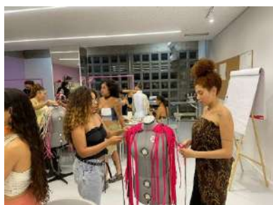
NÚCLEO DE MODA_TECNICAS CROCHÊ, TRICÔ E MACRAMÊ, set