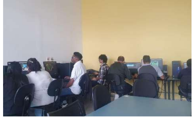
Trilha de Programação de Games, Fábrica de Cultura Diadema, outubro