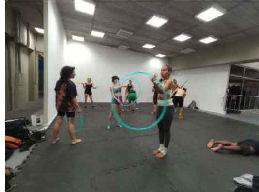
FOLIA, nov 2023