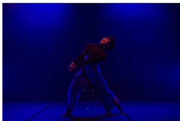
Ciclo II | 7ª Mostra Experimental – Solo (06.10.23)