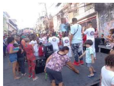
CPR e JSL_Festival 100_ Favela, set 2023