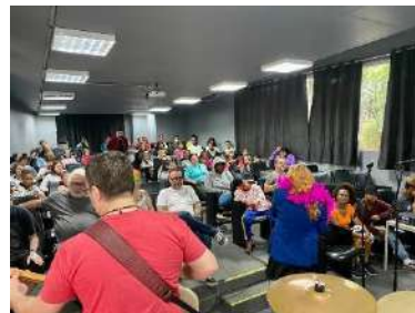
VNC_Show Serenata a Rita Lee, out 2023