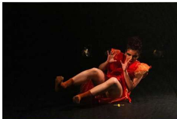
Ciclo II | 7ª Mostra Experimental – Solo (08.10.23)