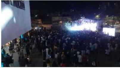
DDM_ANIVERSÁRIO 5 ANOS DA FÁBRICA DE CULTURA DIADEMA, dez 2023