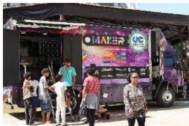
CPR_FESTIVAL TECNICAMENTE FALANDO CAMINHÃO DE INOVAÇÕES COM OFICINAS MAKE, nov 2023