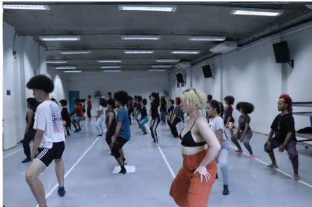
Ciclo I | Aula de Moderno (05.09.2023)