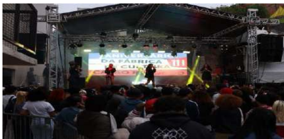
CPR_Aniversário Fábricas de Cultura Capão Redondo 11 anos