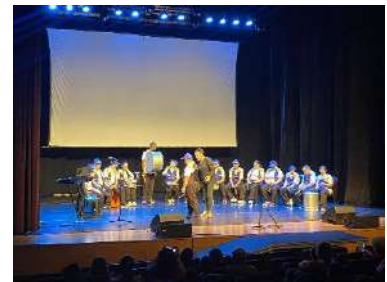
BRL_VIRADA INCLUSIVA COM GRUPO SÓ VENDENDO PRA CRER, dez 2023