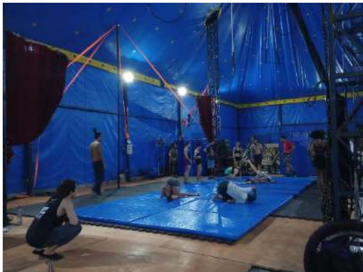
FOLIA, nov 2023