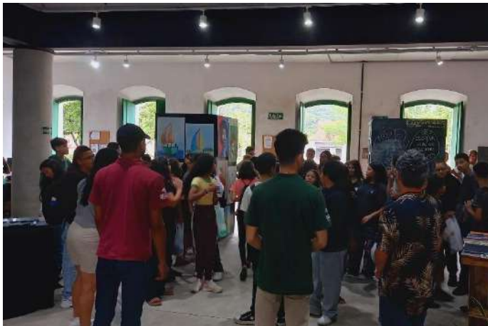
Mostra de Processos, Fábrica de Cultura de Iguape, novembro