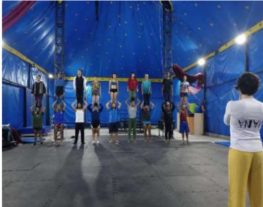
FOLIA, out 2023