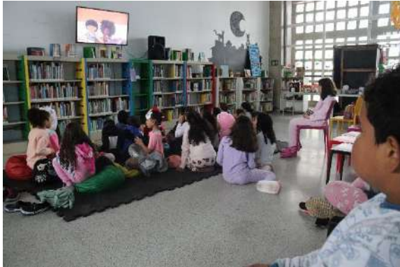
Bibliocine, Fábrica Jd. São Luís, novembro