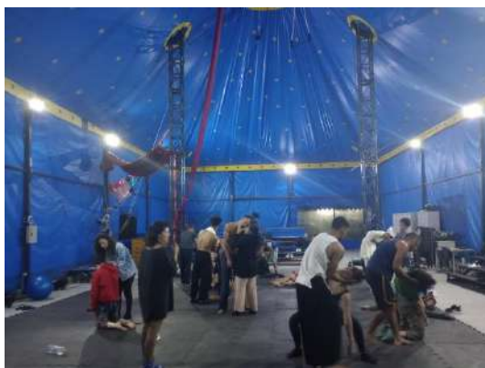
FOLIA, out 2023

Uma consultoria focada na transformação de conflitos, inspirada pela Justiça Restaurativa, visando a apoiar a equipe docente e os aprendizes do Projeto Folia.