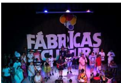
BRL_VIRADA INCLUSIVA COM GRUPO SÓ VENDENDO PRA CRER, dez 2023