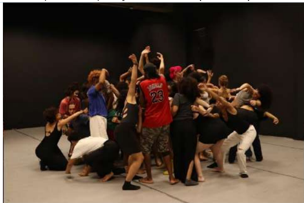
Ciclo I e II | Atividade Integrativa (04.12.23)