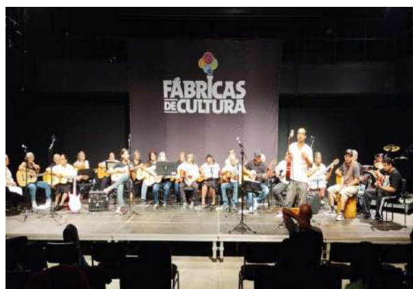
Encontro Musical Trilha de Cordas Dedilhadas, Fábrica Jaçanã, outubro