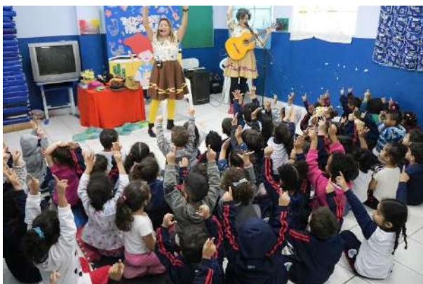
Tricotando palavras, Fábrika Diadema, outubro