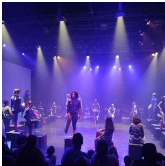
Projeto Espetáculo, Fábrica de Cultura Vila Nova Cachoeirinha, novembro