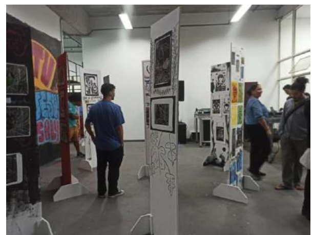
Ateliê de Xilogravura, Fábrica de Cultura Diadema, novembro