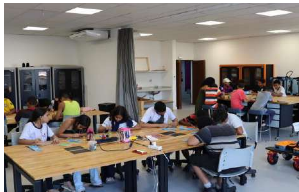
Feira Tecnicamente Falando Aprendizes da Fábrica Capão Redondo, novembro