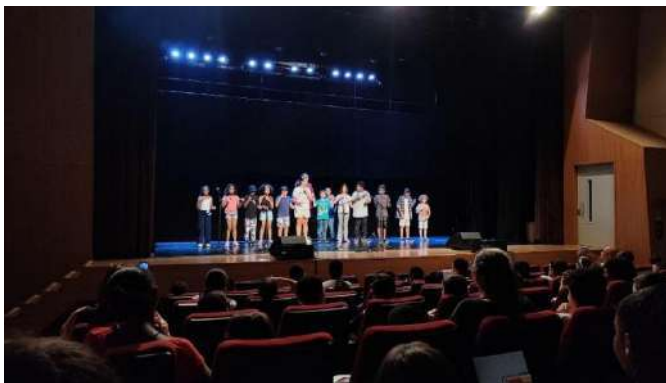
Mostra de Processos, Fábrica de Cultura Diadema, novembro