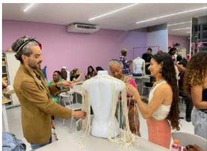
NÚCLEO DE MODA_APOIO PRODUÇÃO E COSTURA, nov 2023