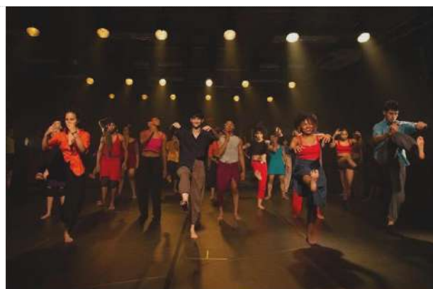
Ciclo I | Espetáculo DeComposição (01.12.23)