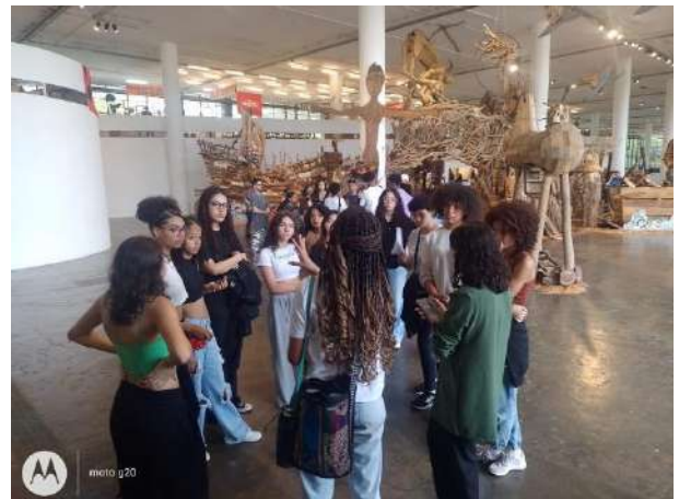
Saída pedagógica, 35ª Bienal de São Paulo, Fábrica de Cultura Diadema, outubro