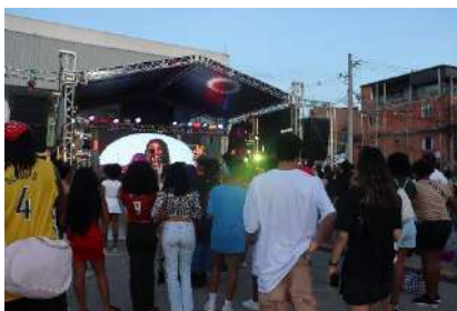
OSC_SANKOFA URBAN GROOVE FESTIVAL, dez 2023