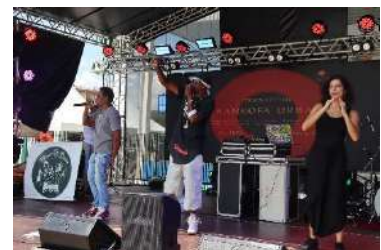
OSC_SANKOFA URBAN GROOVE FESTIVAL, dez 2023