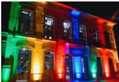
IGP_FESTIVAL LGBT QUÉ ISSO, out 2023