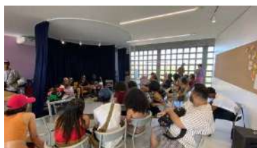
NÚCLEO DE MODA_CROCHÊ CHAVOSO COM ARTESANATO, set