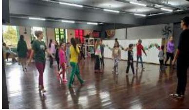
ESTÚDIOS_CORPO EM CENA, COM GRUPO CAIXA PRETA DE TEATRO, out 2023