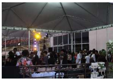
BRL_Festival AfroBrasa, nov 2023