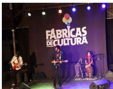
ESTÚDIOS_O SOM DAS FÁBRICAS DE CULTURA, set 2023