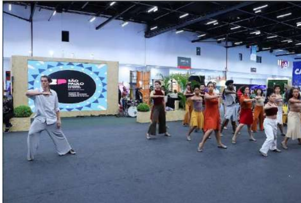
Ciclo II | Feira Sebrae 2023 (17.10.23)