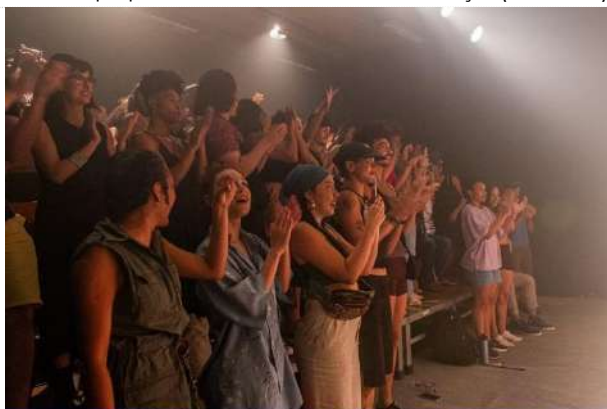
Ciclo II | 7ª Mostra Experimental – Plateia (07.10.23)