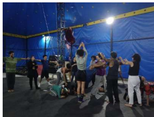
FOLIA, out 2023