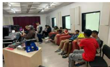
ESTÚDIOS_ATELIÊ DE DUBLAGEM – GRAVAÇÃO, nov 2012