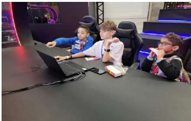
Feira Sebrae Aprendizes da Fábrica Vila Nova Cachoeirinha, outubro