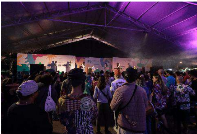
FLI & São Sebastião Literária – Edição especial | Tulipa Ruiz convida Juçara Marçal e Assucena – 7/10