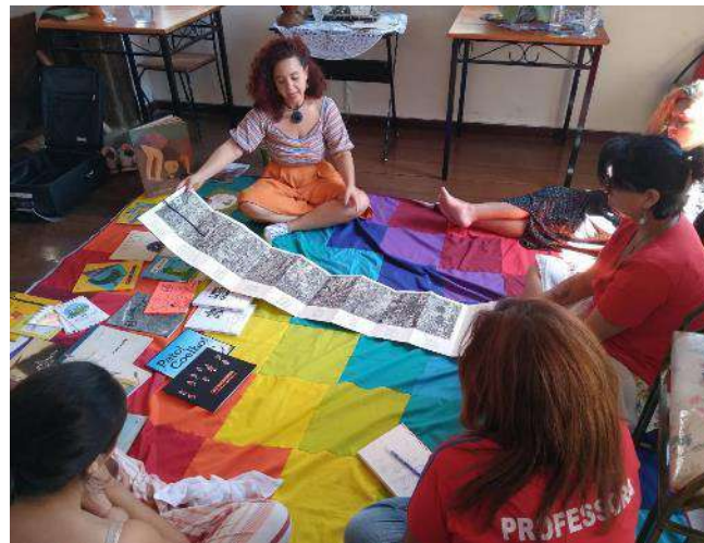
Oficina: mediação de leitura literária e espaços de atuação (São Bento do Sapucaí) – 11/09 a 13/09