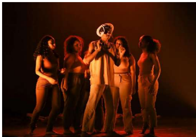
Espectáculo: Eu vim de Lá de São Sebastião Mostra de Dança - 19 de novembro