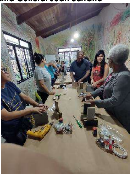
Marcenaria para mulheres! Núcleo de capacitação artística para mulheres – 14/9 a 21/9