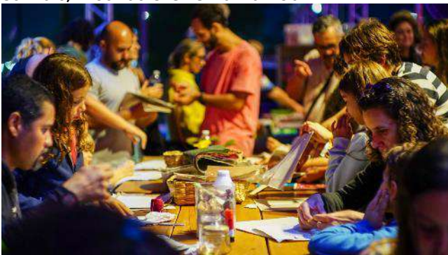
FLI & São Sebastião Literária – Edição especial | Ponto do livro – 6/10 a 7/10