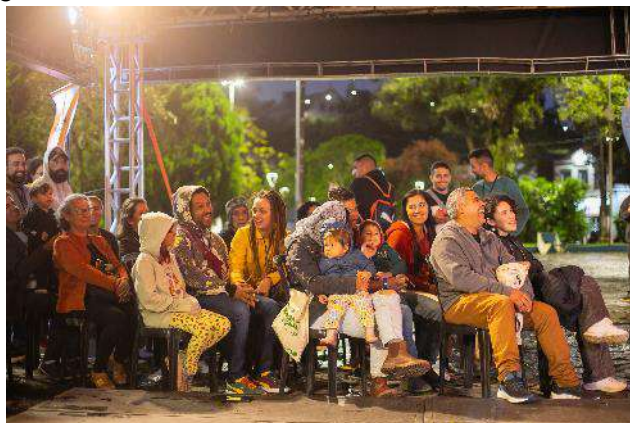
Ciclo de Cultura Tradicional 2023 | Itanhaém - Chegadas e partidas nas ondas do mar – 14/10