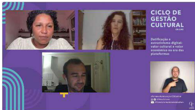
Webinar | Presencial, on-line e imersão: novas formas de pensar o consumo e a participação na produção cultural – 30/10