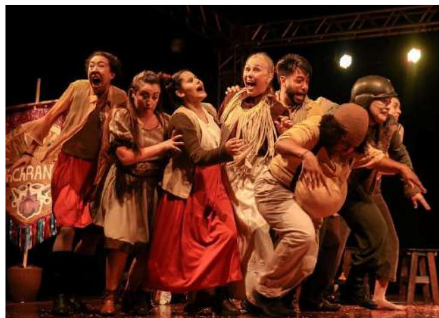
Espectáculo: Jacarandá - CLP- Cia Municipal de Teatro - de Campo Limpo Paulista - Mostra de Teatro dia 14 | 10