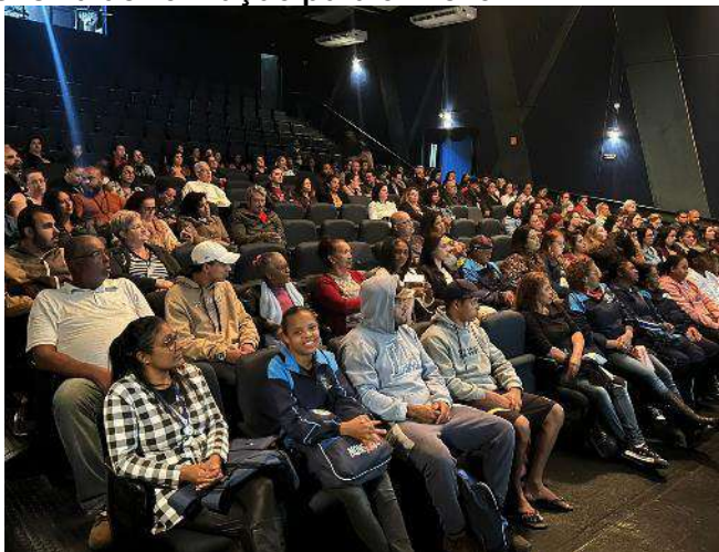
Palestra: o que é funk? Valor social, cultural e musical (Mongaguá) – 14/09