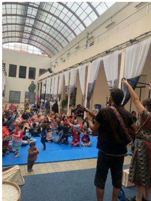
Show: Mundo Aflora – 14/10