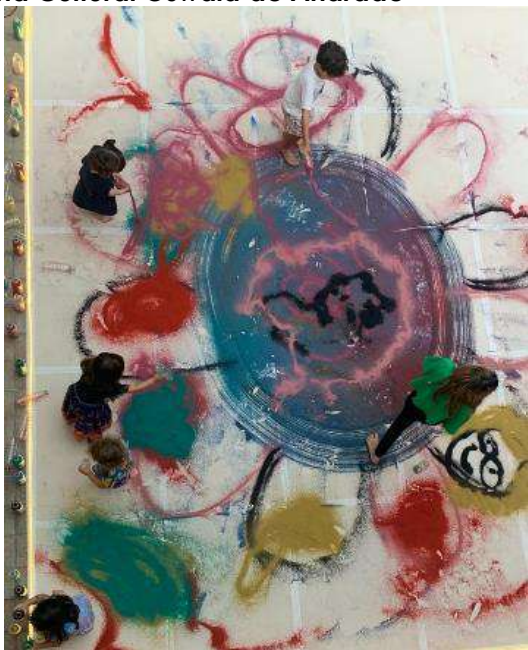
Performance: pintando poesia – 12/10