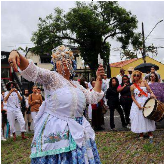
Cortejo Preta Leste: meu apito tem semente de jurema – 25/11