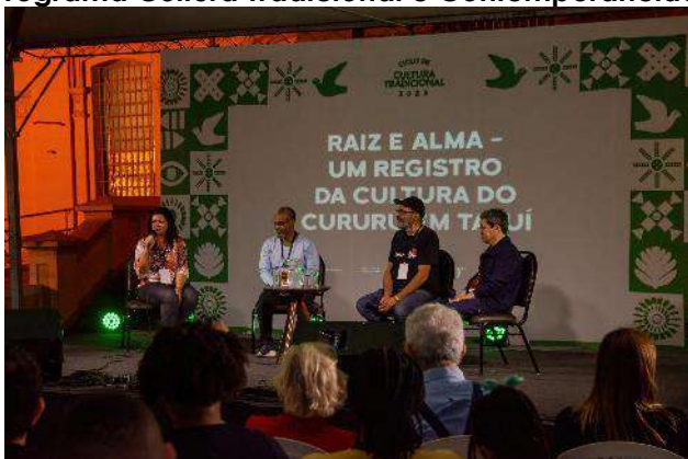
Ciclo de Cultura Tradicional 2023 | Tatuí - Exibição do filme "Raiz e alma – um registro da cultura do cururu em Tatuí" seguida de bate-papo – 30/09