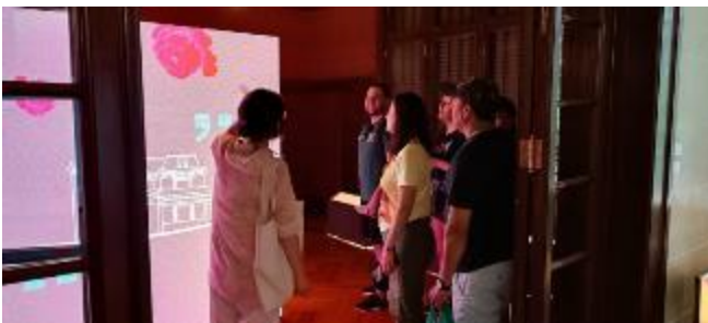
Exposição "Mônica 60 anos – Sempre Fui Forte".