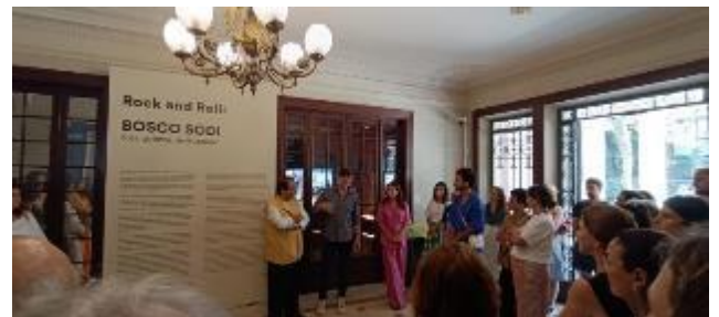
Exposição "Bosco Sodi e os objetos de interesse".