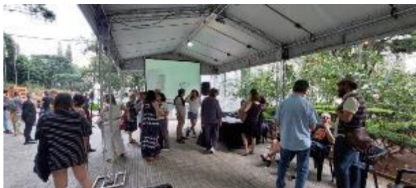
Lançamento da Revista Bufo N°3. Data: 13/04/2024