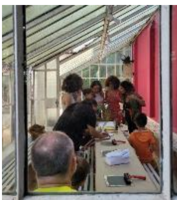
Ação educativa Monotipia com Plantas: Virada da Maturidade. Data: 25/04/2024