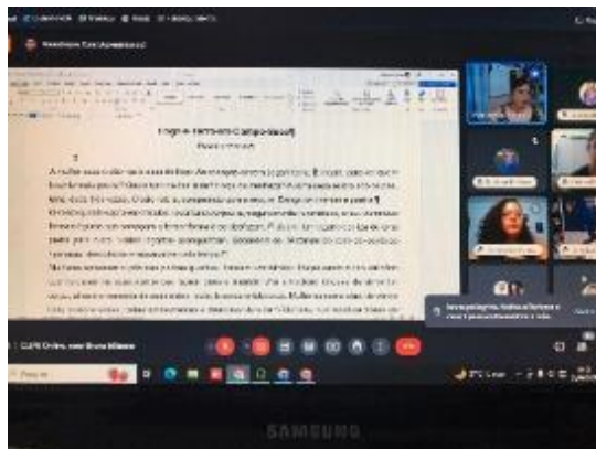
Clípe Online, com Bruna Mitrano. Data: 30/04/2024