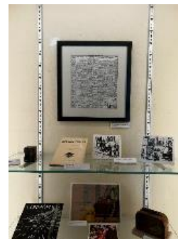
Exposição "Cosmópolis". Abr/2024.