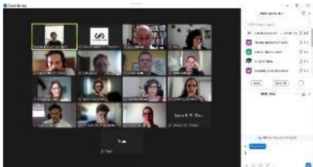
"Programa de Aprimoramento em Tradução Literária". Abr/2024.