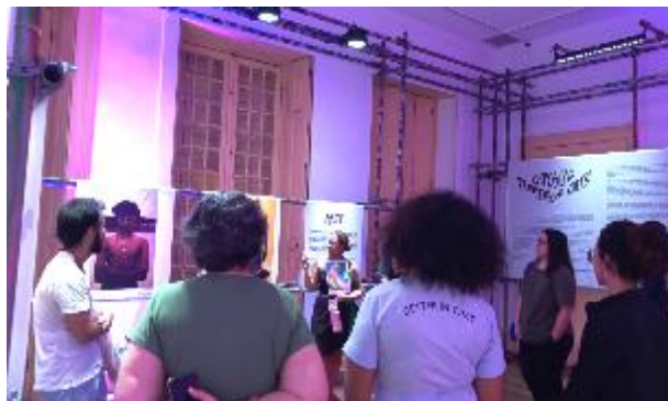
Encontro e passeio Das Representações Modernistas às Identidades Artísticas Faveladas, em parceria com o Museu das Favelas. Ago/2024.

No terceiro quadrimestre, a atuação da programação cultural e educativa foi voltada para o tema "Atrás das Casas: o que mora no quintal", partindo da abordagem do quintal da Casa Guilherme de Almeida que, no processo de readequação do Museu, em 2010, foi transformado em um deck para atividades do museu. Ainda que tornado público, esse espaço — com suas árvores frutíferas, os pássaros que o habitam, os gatos de telhado da vizinhança, além de lembranças da vida familiar na antiga residência, como o túmulo do pequinês Ling Ling — guarda a atmosfera de intimidade e sossego dos antigos quintais urbanos de classe média. A programação de novembro de 2024 promoveu o recém-lançado Projeto Quintal, do Núcleo de Ação Educativa, convidando para uma reflexão sobre o papel desse espaço doméstico na arquitetura e na urbanização e para o contato com memórias e com a natureza na "pequena quinta" da Casa da Colina.