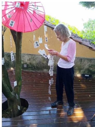
Registro da oficina "A Natureza em Três Versos". Dez/2024.