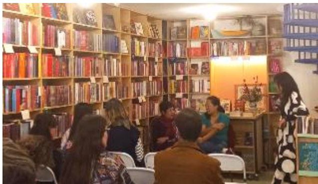
Encontro Uma Fala na Aigo: Vivência Bilíngue. Mai/2024.