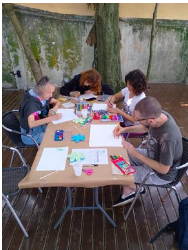
Registro da oficina "Meu Quintal: Histórias e Memórias". Nov/2024.