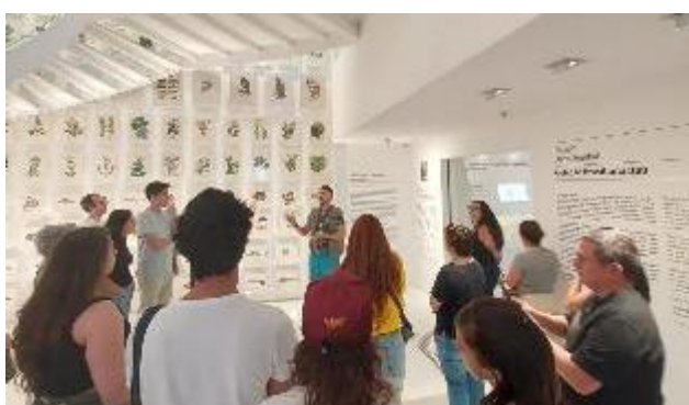
Visita temática Frans Post: Paisagens de um Brasil Holandês, em parceria com o Itaú Cultural. Mai/2024.

No segundo quadrimestre, a programação continuou a realização de ações em parceria com outras instituições culturais, cuja estratégia foi utilizada para ampliar a visibilidade da instituição. Foi realizada interlocução com o Itaú Cultural, Instituto Ricardo Brennand, Museu da Imigração, Museu da Língua Portuguesa, Museu Histórico de Itapira, Livraria Aigo e Museu das Favelas. Foi explorada uma programação que abordou as imagens do Brasil colonial feitas pelo pintor holandês Frans Post, usadas para refletir sobre noções colonizadoras e realidade contemporânea; tratou-se sobre lideranças indígenas e quilombolas em defesa de seus territórios, que mostraram formas novas de viver sua ancestralidade; e foi realizada conversa sobre migração, livros, identidades bilíngues, dando espaço a trocas interculturais, entre outras ações.