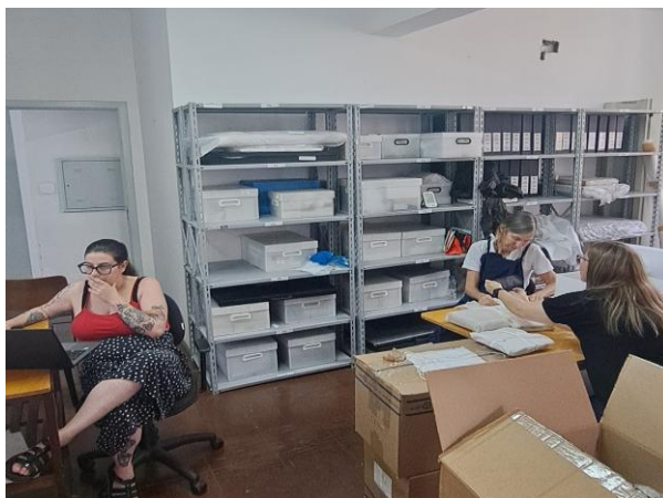
Processo de conferência física dos itens dos acervos a serem transferidos. Nov/2024

Iniciado em 2024, o processo de regularização dos acervos do Museu está em andamento, ação que será continuada em 2025. Considerando esse processo, que envolve equipes bem instruídas e organizadas, além de tempo necessário para verificação das coleções, a nova Política de Acervo será apresentada em 2025.