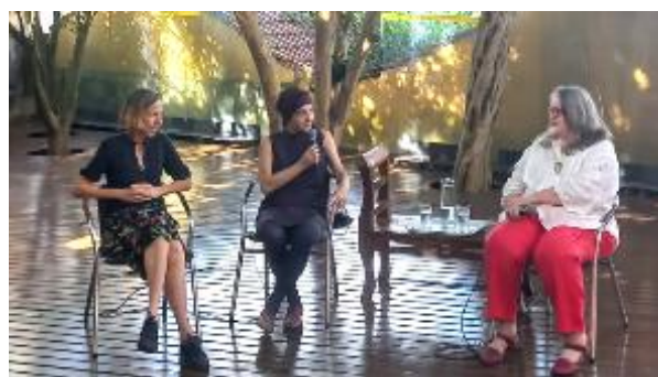
"Estrangeiros em São Paulo, Ontem e Hoje". Abr/2024.

No segundo quadrimestre, a programação continuou a realização de ações em parceria com outras instituições culturais, cuja estratégia foi utilizada para ampliar a visibilidade da instituição. Foi realizada interlocução com o Itaú Cultural, Instituto Ricardo Brennand, Museu da Imigração, Museu da Língua Portuguesa, Museu Histórico de Itapira, Livraria Aigo e Museu das Favelas. Foi explorada uma programação que abordou as imagens do Brasil colonial feitas pelo pintor holandês Frans Post, usadas para refletir sobre noções colonizadoras e realidade contemporânea; tratou-se sobre lideranças indígenas e quilombolas em defesa de seus territórios, que mostraram formas novas de viver sua ancestralidade; e foi realizada conversa sobre migração, livros, identidades bilíngues, dando espaço a trocas interculturais, entre outras ações.