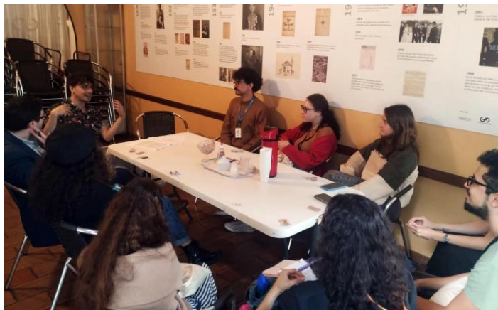
Formação conjunta entre o Educativo do Arquivo Histórico Municipal e a Casa Guilherme de Almeida. Nov/2024.