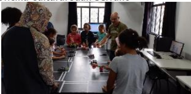
Robótica e Cidadania no Trânsito, com Arduino, SP 470 anos - 25/01 a 25/01