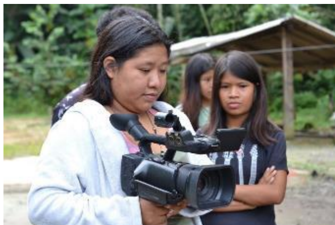
Ciclo de Cultura Tradicional em São Vicente - 22 a 31/03/2023