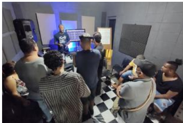
Produção de Áudio: Cabos, Sinais E Conectores 03/04 a 24/04