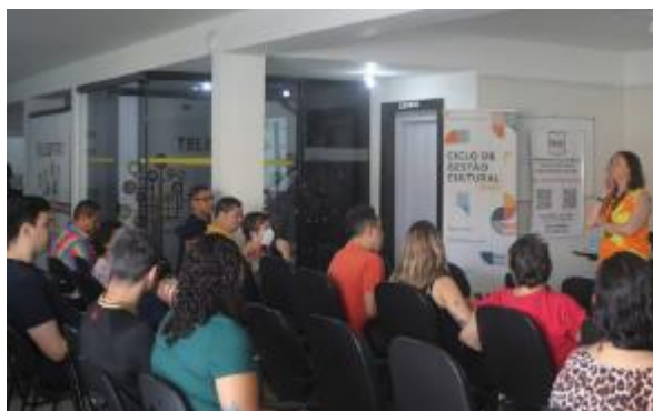
Oficina | Tirando do papel: estratégias para produzir e financiar projetos culturais - 22/03 a 24/03