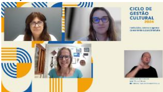
Instituições, setores e agentes da economia cultural brasileira - 04/03/2024