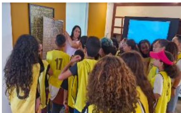
Visita Mediada Exposição Geoprópolis 16/04/2024