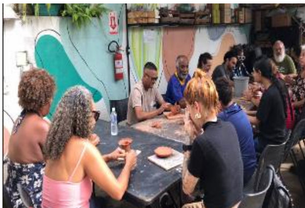
Oficina de criação de esculturas e reciclagem de argila. 19/01/2024 a 23/02/2024