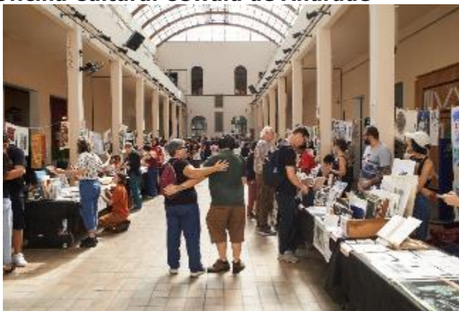
3ª Edição. A.F.A.G.O Feira de Artes Gráficas da Oswald 14/03 a 20/04