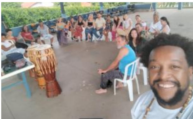
Oficina: o Jongo (Paraíso) - 09/03 a 10/03