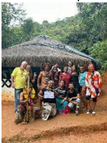
Ciclo de Cultura Tradicional em Guarulhos - 29/03 a 07/04/2024