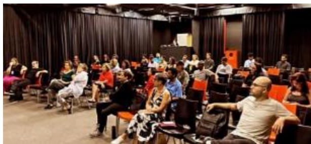
Elaboração de projetos culturais (Mogi das Cruzes) - 20/02 a 21/02